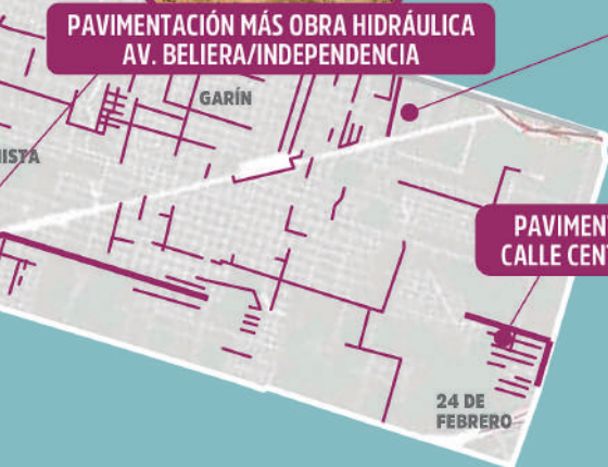
PAVIMENTACIÓN CALLE CENTENARIO