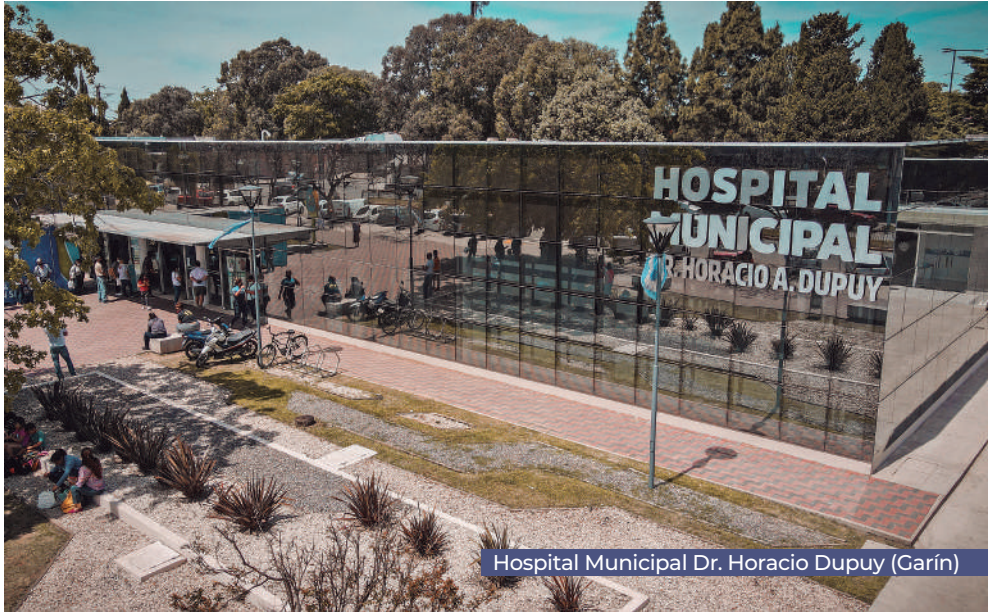
Hospital Municipal Dr. Horacio Dupuy (Garín)

En 2015 solo había centros de atención prim