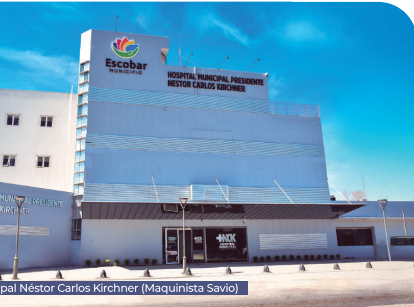
Hospital Néstor Carlos Kirchner (Maquinista Savio)