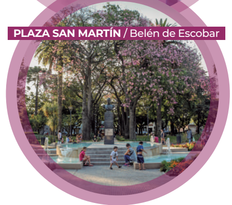
PLAZA SAN MARTÍN / Belén de Escobar

73 ESPACIOS VERDES CREADOS EN LOS BARRIOS DE TODAS LAS LOCALIDADES