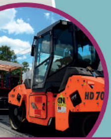
ASFOFOS Y REPAVIMENTACIÓN PROVINCIAL N°26