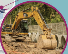
PAVIMENTACIÓN MÁS OBRA HIDRÁULICA AV. BELIERA/INDEPENDENCIA