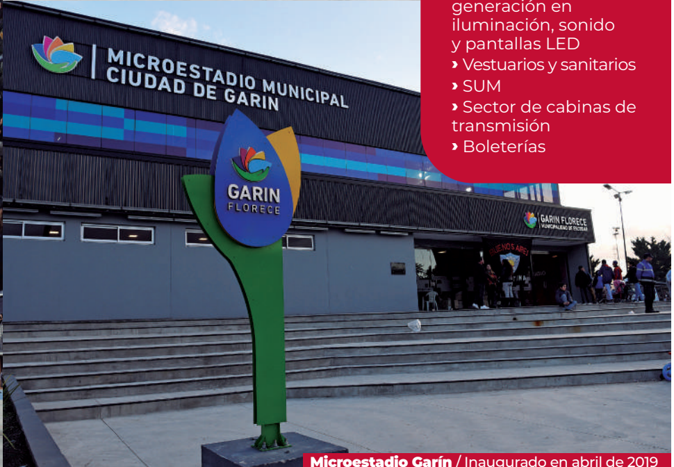
Microestadio Garín / Inaugurado en abril de 2019