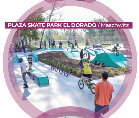
PLAZA SKATE PARK EL DORADO / Maschwitz