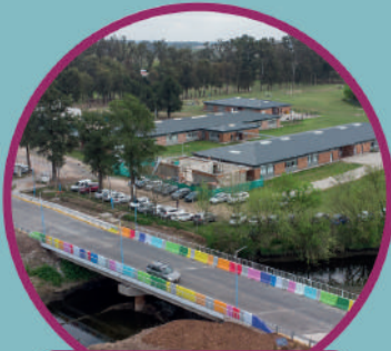
PUENTE VEHICULAR INDEPENDENCIA