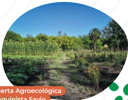
Huerta Agroecológica Maquinista Savio

Mediante el programa “ Biocorredores ” proponemos la restauración ambiental con el fin de reducir, mitigar e incluso revertir, los daños producidos por el ser humano. Por eso, aumentamos la heterogeneidad del paisaje, con mayor presencia de refugios silvestres y huertas agroecológicas, mejorando la situación de los polinizadores y sus servicios ambientales.