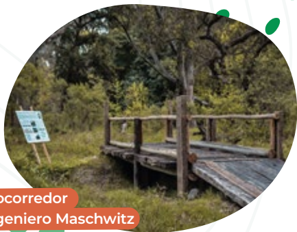
Biocorredor Ingeniero Maschwitz