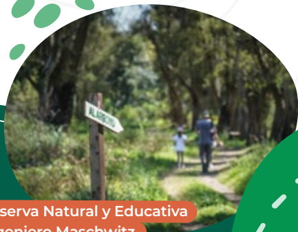
Reserva Natural y Educativa Ingeniero Maschwitz